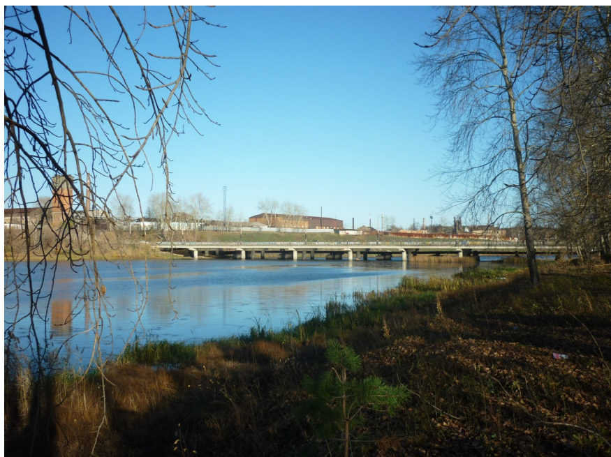
«Городской пруд» Шестакова Анастасия