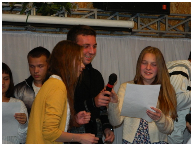
Наш класс принимает участие в конкурсах

начале пути, что не захотели расходиться по своим каютам, а дружно сидели в одной каюте. Нас там было 18 человек! Это было настолько здорово и весело. Нам не пришлось скучать. Мы общались, делились своими секретами, чувствами и