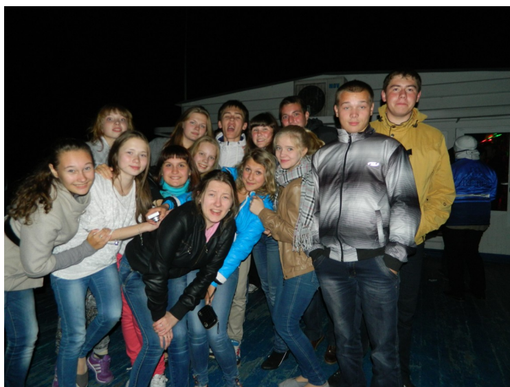
На теплоходе наш 10 класс и ночь

увлекательно, мы были друг за друга. Конечно вторую ночь мы не в силах были выдержать без сна. Но даже спать нам было весело и интересно. Не все разошлись по своим местам, 8 человек легли спать в одной двухместной каюте.