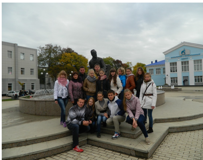
Усадьба П. И. Чайковского в г. Воткинске

На обратном пути на теплоходе, мы уже с остальными отдыхающими играли в «Мафию». Это было так