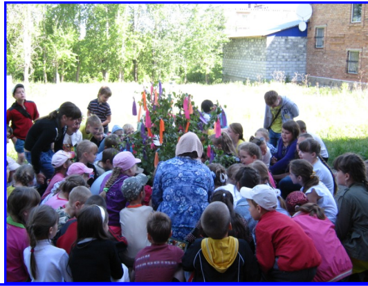
Праздник Троица. 7 июня 2012 года

много нового. Для ребят были организованы походы в