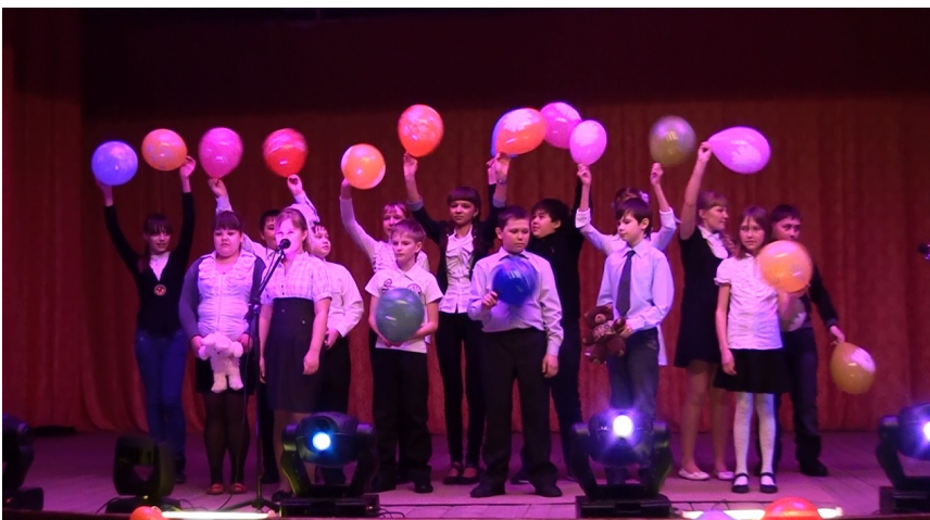
Фото: Информационный центр