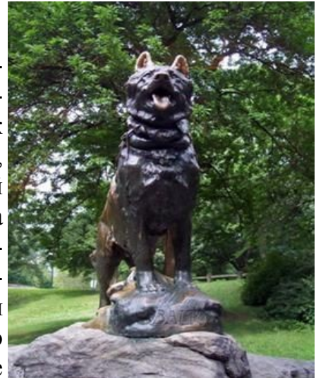
Памятник псу Балто в Нью-Йорке

Так же мы будем помнить пса, который спас своего хозяина, ценою