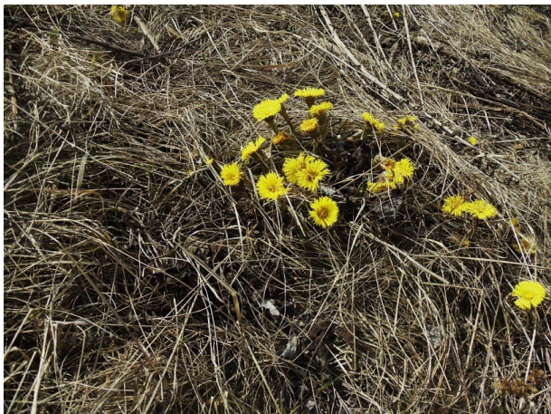
Отогрелись на первом весеннем солнышке