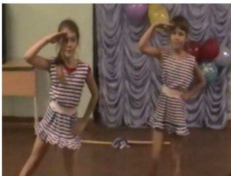
«Морячки» из 4А класса

В течение учебного года в нашей школе проходит много праздников различной тематики. Но они объединены одним—желанием учеников сделать каждый праздник запоминающим. Ребята, совместно с учителями, организуют замечательные концерты.