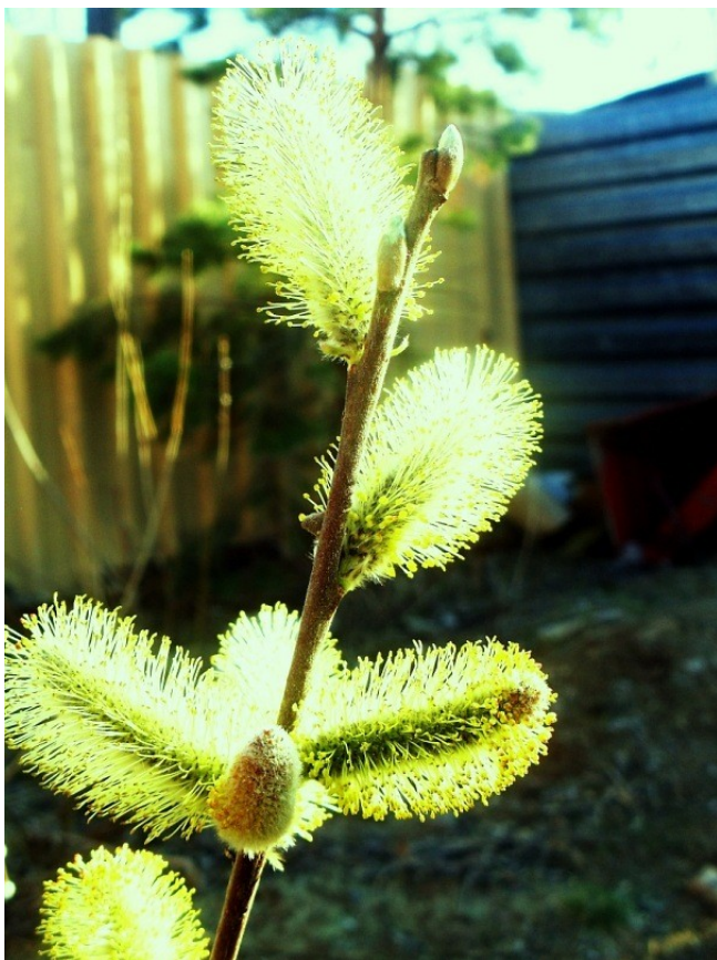
Распушилась к вербному воскресенью